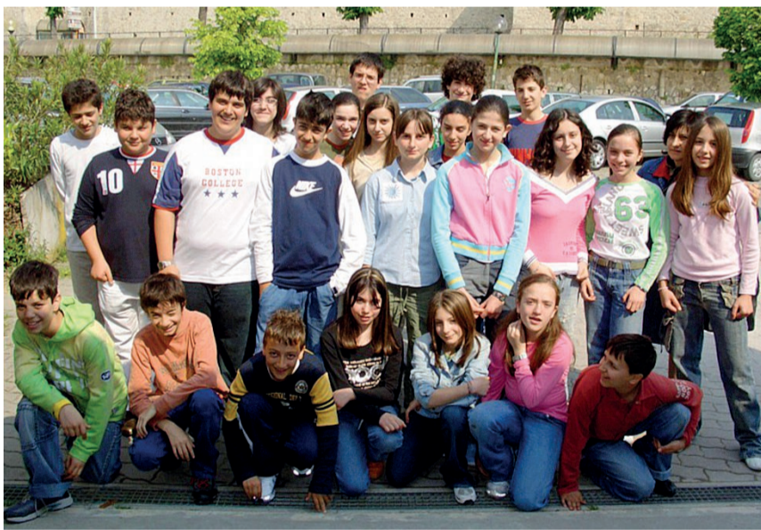
F.F. Todì E' l'anno scolastico 2006, in evidenza la II° F della scuola media Cocchi Aosta

Chi è in possesso di vecchie foto e vuole vederle pubblicate può farlo e la modalità è semplicissima. Basta spedirle a scuola@gruppocorriere.it specificando il nome dell'istituto, la città, la sezione e l'anno scolastico. Naturalmente se ci sono, molto graditi anche i nomi dei protagonisti e degli insegnanti del tempo.