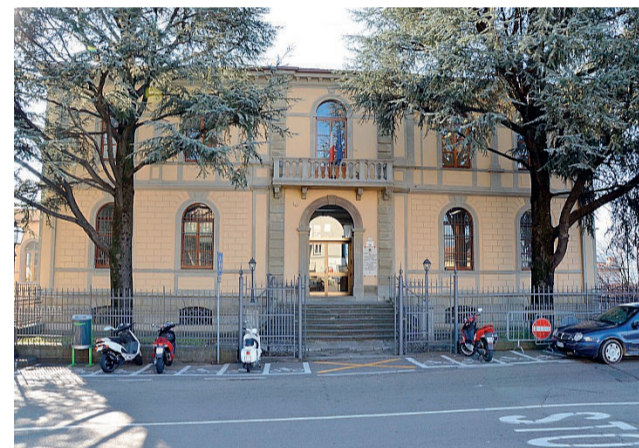
Scuola e lavoro Collaborazione tra Confartigianato Imprese Arezzo e l'Isis Enrico Fermi di Bibbiena

scolastico e del corpo docente, che ha già dato vita a esperienze di successo come l'apprendistato duale. Ora Confartigianato rilancia con una nuova iniziativa dedicata agli studenti prossimi al diploma: lo Start up day. L'appuntamento che si è svolto venerdì 17 aprile nella suc-