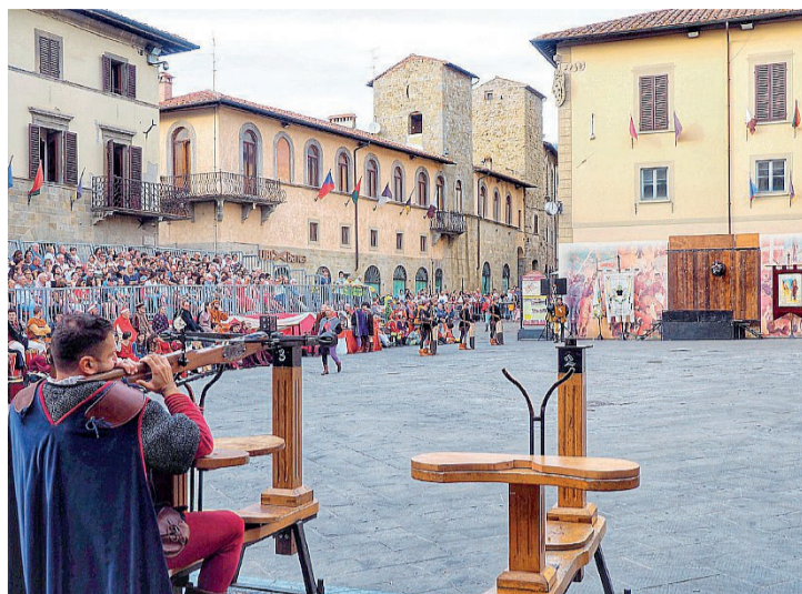
Palio della Balestra A settembre l'atteso appuntamento in piazza Torre di Berta

del territorio. Il Palio rievoca infatti antiche sfide tra città rivali, simbolo di orgoglio e identità. Ancora oggi, questo spirito competitivo è vissuto con passione, ma sempre nel