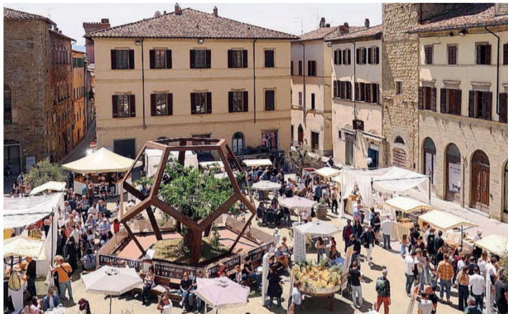
Primi dei Primi La manifestazione si è tenuta a Sansepolcro dal primo al 3 maggio

con musica dal vivo e spettacoli. Alcuni musicisti si sono esibiti nelle piazze, creando momenti di festa e di aggregazione. Ci sono stati anche artisti di strada e piccole performance che hanno reso la passeggiata ancora più interessante. Tutto questo ha contribuito a creare un ambiente in cui il cibo non è stato l'unico protagonista, ma ha fatto parte di un'esperienza più grande. La sera è stato probabilmente il momento più suggestivo dell'evento. Quando le luci si sono accese e le strade si sono riempite di persone, il centro storico ha assunto un'atmosfera particola-