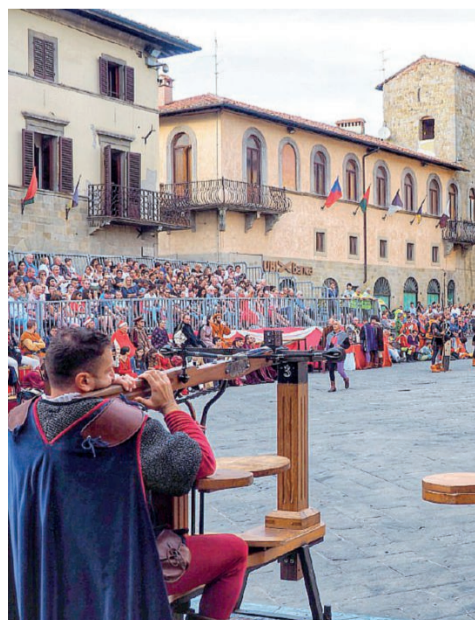
Il Palio della Balestra L'emozione della prova dei balestrieri e la maestria degli sbandieratori

■ Se chiudete gli occhi e ascoltate bene, tra le mura della nostra Sansepolcro si può ancora sentire un suono speciale: il rullo dei tamburi, il fruscio delle bandiere che volano alte nel cielo. Tutto inizia con un silenzio che fa battere il cuore. Il balestriere prende la mira, appoggia l'occhio, trattiene il respiro e... sbam! La verretta vola velocissima verso il corniolo, quel cerchio di legno che sembra piccolissimo da lontano. Ma il Palio non è solo una gara, è una festa a colori. I vestiti delle dame e dei cavalieri, sembrano usciti da un quadro di Piero della Francesca! Velluti rossi, cappelli con piume e ricami che brillano sotto il sole di settembre. Ho chiesto a chi vive il Palio da vicino, cosa si prova a sfilare lungo le vie del centro: "Quando batto il primo colpo di tamburo, mi emoziono sempre!", mi ha raccontato