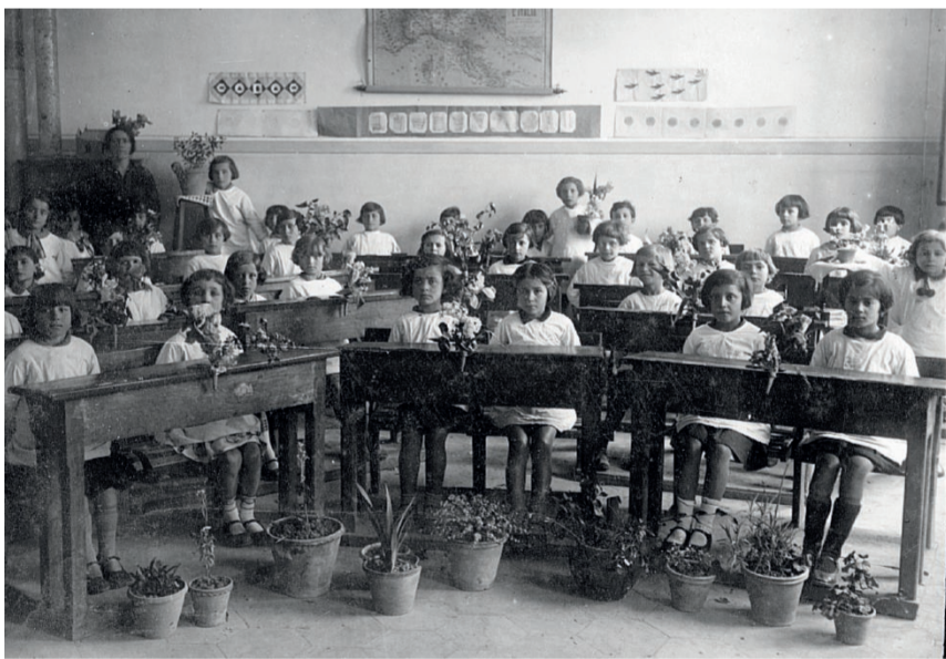
F.F. Umbertide 1931 La scuola femminile

Chi è in possesso di vecchie foto e vuole vederle pubblicate può farlo e la modalità è semplicissima. Basta spedirle a scuola@gruppocorriere.it specificando il nome dell'istituto, la città, la sezione e l'anno scolastico. Naturalmente se ci sono, molto graditi anche i nomi dei protagonisti e degli insegnanti del tempo.